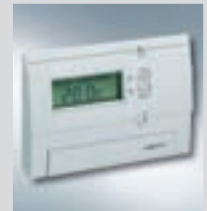
Zdalne sterowanie Vitotrol 100, typ UTD