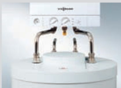
Vitopend 100-W 10,5 do 30 kW