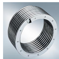
Powierzchnia grzewcza Inox-Radial z wysokojakościowej stali szlachetnej